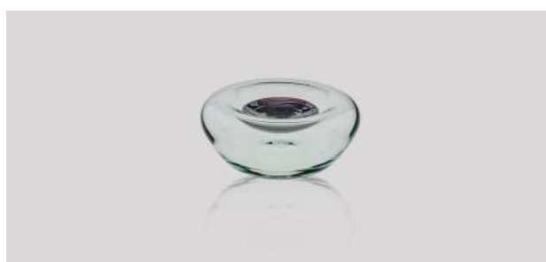
5861.4 X Cuenco Soplado